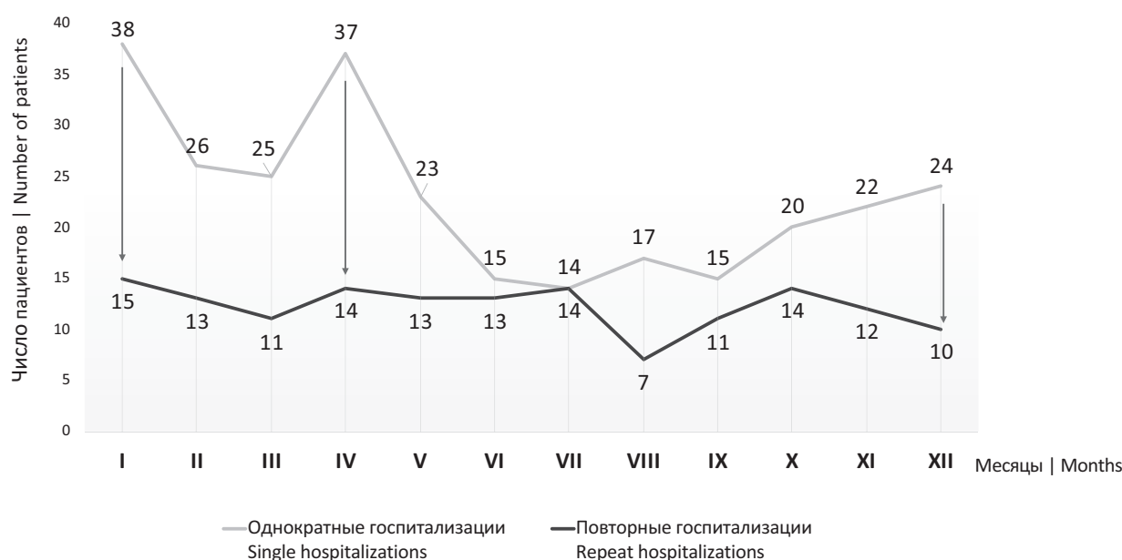
Рис. 1. Динамика госпитализаций по поводу обострения хронической обструктивной болезни легких с 01.01.2015 по 31.12.2018 по месяцам

50,7% пациентов контрольной группы и 29,2% основной имели среднетяжелое течение ХОБЛ, 37,7% пациентов контрольной группы и 56,5% пациентов основной — тяжелое, 10,1 и 14,3% соответственно — крайне тяжелое течение. У 1,5% пациентов в контрольной группе было легкое течение. В основной группе пациентов с тяжелым