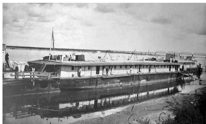
Баржа-лазарет имени ее высочества великой княгини Ксении Александровны Barge-hospitals named after Her Highness Grand Duchess Ksenia Alexandrovna