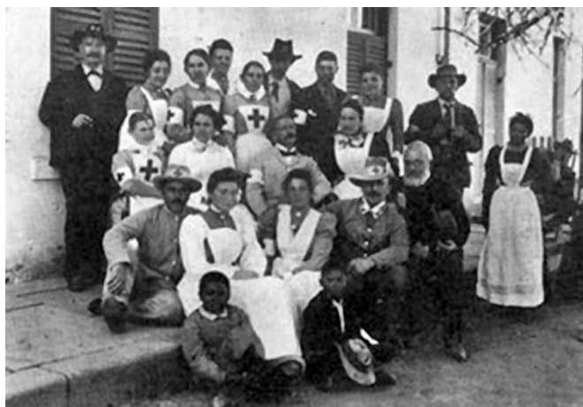
Голландские и Русские волонтеры, оказывающие помощь бурам в полевом госпитале

За период боевых действий «Царица» совершила 6 эвакуационных рейсов.