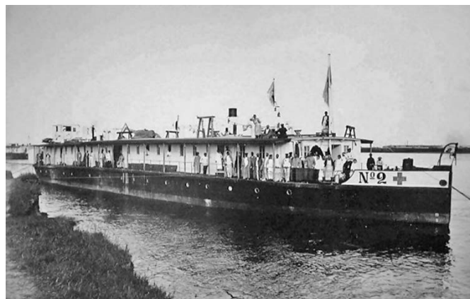
Елизаветградская баржа-лазарет № 2 Elizavetgrad Barge-Hospital No. 2