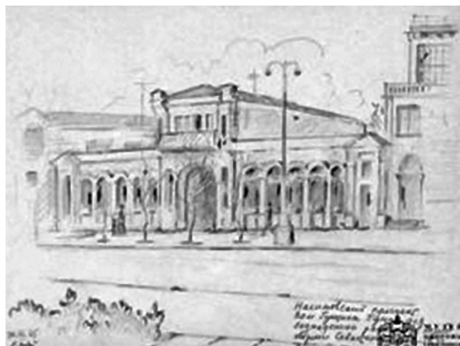
«Гушин дом». Музей Обороны Севастополя «Gushchin House». Museum of Defense of Sevastopol

26.01.1863 г. последовал приказ военного министра Д.А. Милютина о введении, по договоренности с Кре-