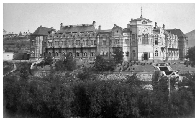
Больница Мариинской общины. Порт-Артур. 1904–1905. Общий вид здания больницы Hospital of the Mariinsky Community. Port Arthur. 1904–1905. General view of the hospital building