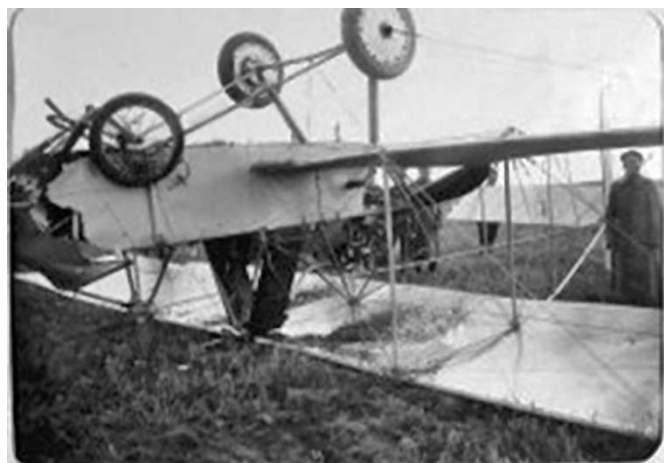
Авиационная рота и 5-й дивизион при 12-й армии. 1915 г. Разбитый после неудачной посадки биплан поручика роты Гринев

Развитие воздухоплавания привело к необходимости создания медицинской службы авиационных частей для оказания помощи пострадавшим военным летчикам. Не-