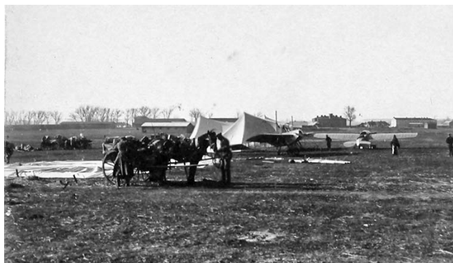
4-я авиационная рота — Виленский ВО. XX корпусной авиационный отряд на войне 1914–1915 гг. Вид части аэродрома, на переднем плане повозка с оборудованием для лазарета. Август 1914. Люблин

The 4 th aviation company — Vilnius Military District. XX Corps Aviation Squadron during the war in 1914–1915. View of the aerodrome, with a cart in the foreground carrying equipment for a field hospital. August 1914. Lublin