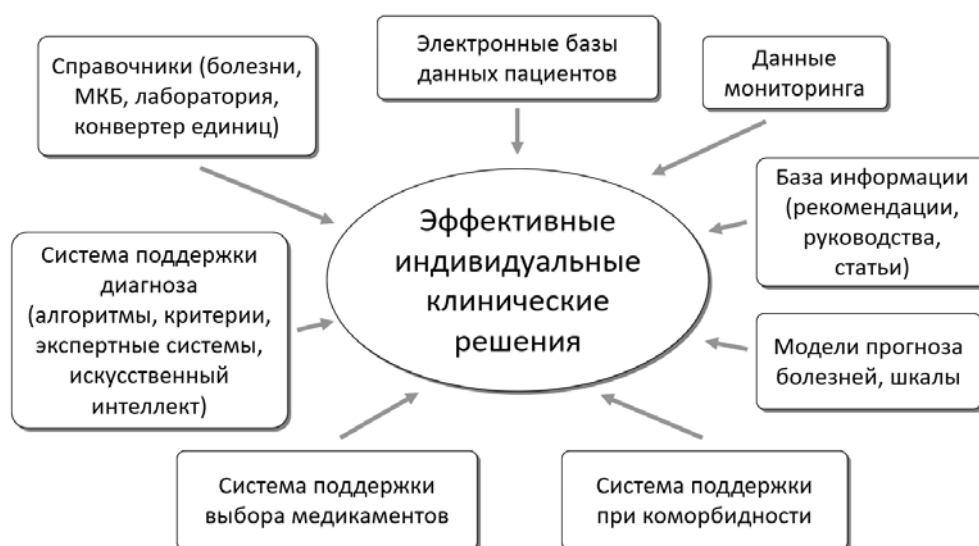
Рис. 1. Элементы системы поддержки клинических решений. МКБ — международная классификация болезней