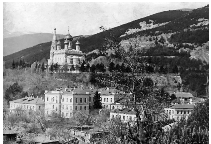
Шипка. Русский храм-памятник с семинарией Shipka. Russian memorial church with a seminary