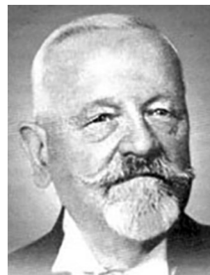
Георгий Ермолаевич Рейн в эмиграции в Болгарии Georgiy Yermolaevich Rein in emigration in Bulgaria

ным листом и занесением на мраморную доску. Ученик А.Я. Крассовского. Доктор медицины (1876). Участник Русско-турецкой войны. В 1908 г. получил звание Почетного лейб-хирурга двора Его Императорского Величества и чин действительного тайного советника. Первый министр здравоохранения России [4].