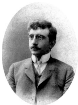
Владимир Петрович Воробьев (из альбома к 100-летию Харьковского университета, 1905 г.)

Заведующий кафедрой нормальной анатомии в 1920–1921 гг. — Владимир Петрович Воробьев (1876–1937).