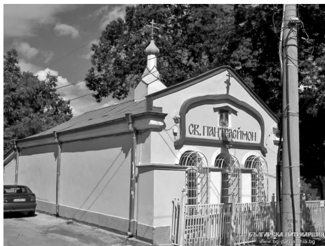
Храм св. Пантелеймона: русская «духовная пристань» в Болгарии