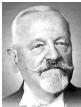
Георгий Ермолаевич Рейн в эмиграции в Болгарии

С 1919 г. Г.Е. Рейн возглавлял кафедру акушерства и гинекологии Софийского университета (до 1926 г.). Параллельно преподаванию он открыл в Софии благоустроенную клинику, организовал школу акушеров, работал в Софийском «Доме матери», издал на болгарском языке учебник «Оперативное акушерство» 11 .