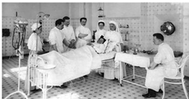
Слушатели академии в зале акушерской гинекологической клиники Виллие [4]

В 1908 г. Г.Е. Рейн получил звание почетного лейб-хирурга двора Его Величества и чин действительного