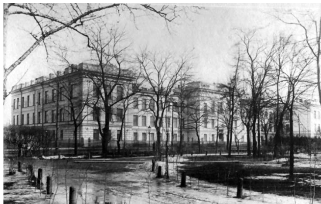
Акушерско-гинекологическая клиника Виллие (ныне — клиника госпитальной хирургии), 1908–1910 гг. (вид со стороны парка академии)